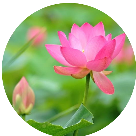
協力／大賀ハスのふるさとの会