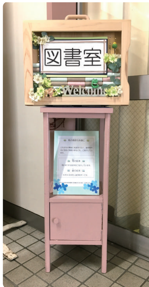
図書スタッフによる紙芝居の枠を使ったウェルカムボード