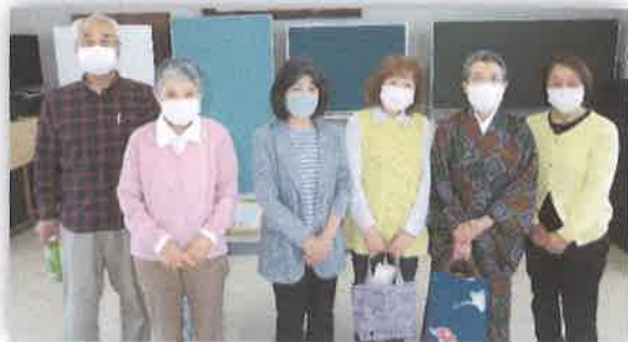
😊 クラブ連絡会 新役員の皆様 😊