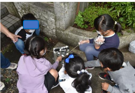
サモア（マシュマロ）