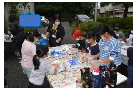
野外料理に挑戦だね。