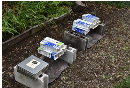
カートンドッグ、とってもおいしいね。