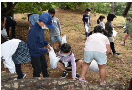
松ぼっくりをたくさん拾って、的当てゲーム