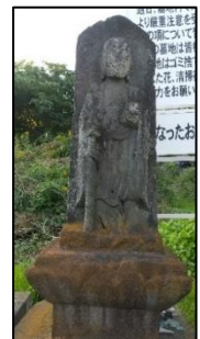
三丁目墓地の地蔵