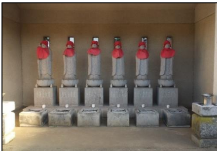
幕張・宝幢寺の六地蔵