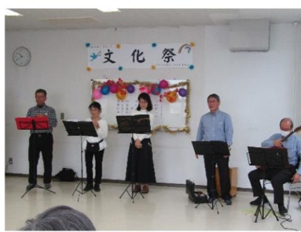
オカリナ・碧い風