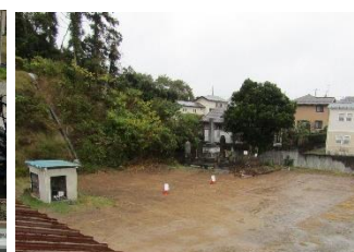
工事中 → 解体後