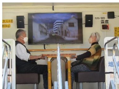
静止画ではわかりませんが震度7を経験しています