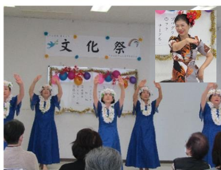
フラサークル・シーナ