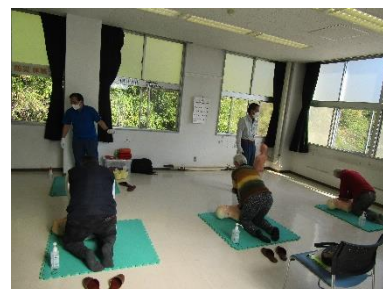
救命措置を学んでいます