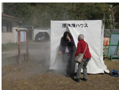
煙がすごすぎて前が見えません