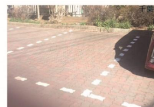
駐車場 (最大 8 台)