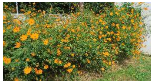
夏の向日葵、百日草(上)、秋のコスモス(下)