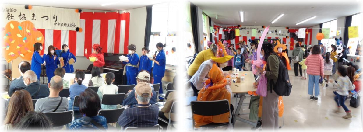
【ハロウィン🎃であそぼう!】

コロナ禍では「三密回避」が叫ばれ、“参集”することができない日々が続き、人と人との繋がりが希薄になっていくことが心配されました。4年ぶりの社協まつりでは、“集う”ことの楽しさ、大切さを改めて認識いたしました。（もちろん、コロナウイルスやインフルエンザ等が今だに流行していますので、感染予防対策は欠かせません。）公民館は“つどい まなび つなぐ”がモットーです。小さいお子様からお年寄りまで、皆様が笑顔で集まれる場として公民館をご利用いただけたことは大変うれしく思います。今後も皆様に気持ちよくご利用いただけるよう努力してまいります。