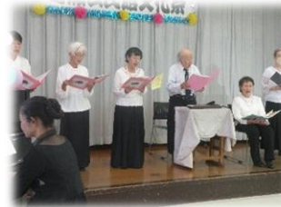
「コーラス」 コーラス野の花