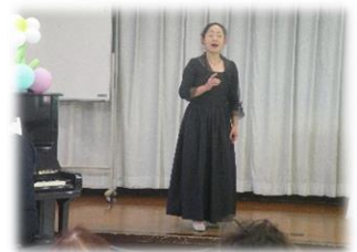
「伊藤先生と歌おう」