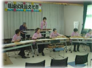
「大正琴の演奏」 葛城大正琴クラブ