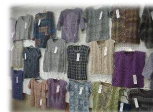
あざみ手あみ教室