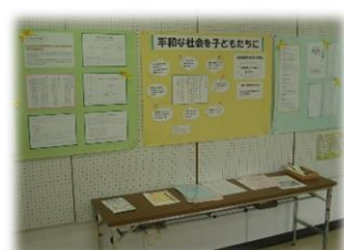
憲法おしゃべり会