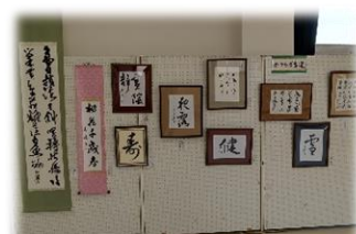
かつらぎ書道クラブ