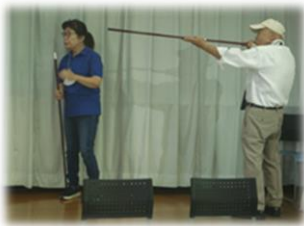
「吹き矢の体験」 スポーツ吹き矢