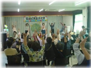
「コーラス」 てんとう虫