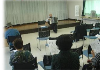
「千葉県の歌巡り」 アコーデオンと歌おう