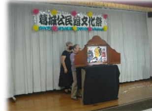
「民話語り」 かつらぎ民話をかたる会