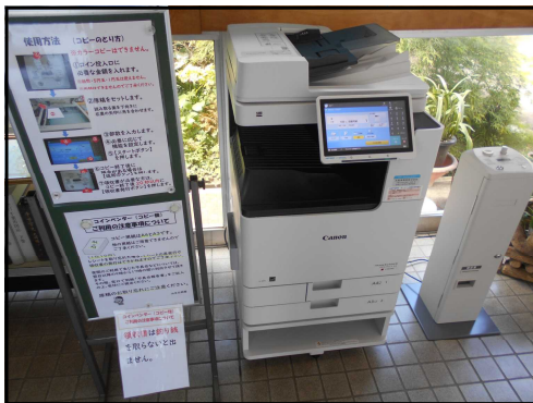
<廊下に設置されたコピー機>

★ご利用団体様用に新しくコピー機(コインバンダー)を廊下に設置しました。使用手順と注意事項が掲示してありますのでご確認ください。用紙サイズはA4とA3でいずれも1枚10円です。小銭のご用意をお願いします。領収書が必要な場合は、使用后20秒以内に領収書発行ボタンを押してください。それを過ぎてからの発行はできませんのでご注意ください。その他、使用上の注意事項をご覧ください。不明な点がございましたら事務室までお声かけください。なお、図書室の著作物等のコピーはお控えいただきたいと思っておりますので、ご注意ください。