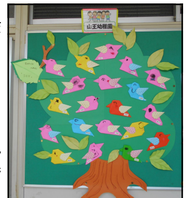
<山王幼稚園の園児作品>

★今月の図書室のお休みは5月18日(木)です。ご注意ください。また、図書返却ボックスを公民館玄関前に出しておりましたが、玄関を入ったすぐ右側に移しましたのでご利用の際はそちらへお願いいたします。