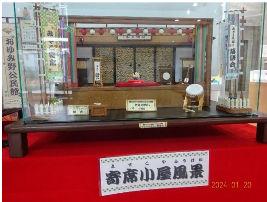
フォーエヴァーさんの落語のジオラマ

編集・発行 千葉市おゆみ野公民館 千葉市緑区おゆみ野中央2丁目7番地6 電話 043-293-1520 FAX 043-293-1521