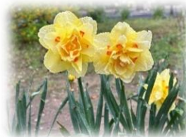
【新宿公園 八重咲水仙】

千葉市保健福祉局 健康福祉部 健康推進課から発行されたパンフレットに出ているキャッチフレーズです。「人生100年時代」と言われるようになりました。寝たきりや介護を必要としない健康