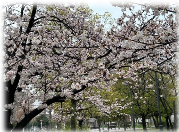
【 新宿公園 4月7日撮影 】

「山笑う」は春の季語だそうです。山々も、そして学校を囲む桜並木も、やっと訪れた春の暖かさに微笑んでいるのでしょうか。新学期を迎える学校が微笑みのスタートになるといいですね。