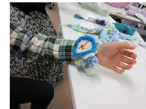
編み物好きの男子の作品(左)とお母さんの作品(右)です。

なっただき、地域の親子に、自分の指を使って編む「指編み」を体験してもらいました。学生さんが準備してきたお花や星などの沢山のモチーフと自分の指で編んだものを組み合わせて、髪飾り、首飾り、腕輪マフラーなどを作りました。参加者にとっても、学生にとっても楽しい充実した学びの時間になりました。