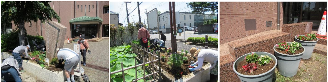
5月18日(土)花植えボランティアの様子

また、 5月18日(土)今年度初めて「花植えボランティア」を募集して 、千葉市からいただいた花の苗を植えていただきました。除草作業で見違えた花壇が、きれいな花が加わることで、さらに素晴らしく生まれ変わりました。午後の熱い日差しの中、本当にありがとうございました。