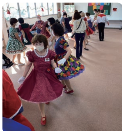
クリスマス会の様子です

指導者の指示で男女8人がカントリー音楽に合わせて踊るスクエアダンスです。 体と心の健康づくりに音楽に乗って、楽しく踊ります。