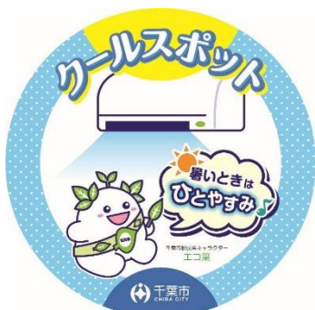
クールスポットのマーク

A 主に2階のロビーにいくつか椅子を置いてあります。クールスポットは熱中症等防止するための避難場所なのでテーブルの用意はありませんが、会議室などには机がありますので、空いている場合は開放する場合があります。