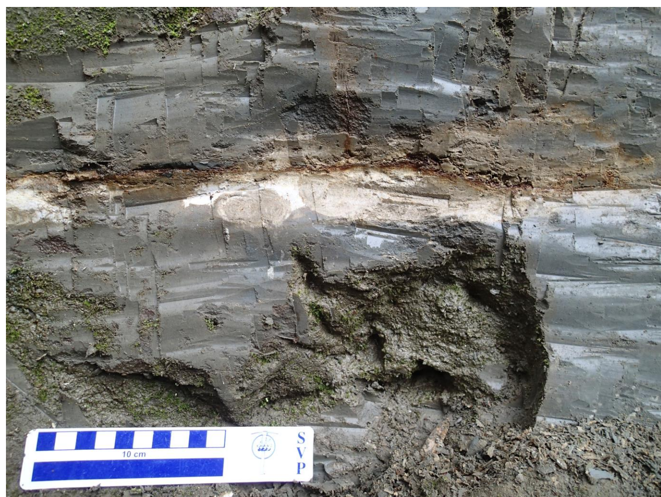
チバニアン期の始まりを告げる火山灰層