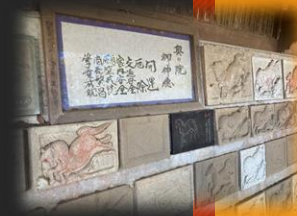
奥之院・馬頭観音

☆今年度も、郷土の歴史について理解を一層深めるため全2回講座としました。 ☆10月下旬に長沼郷土歴史クラブの資料展示を館内ロビーにて予定しています。 詳細は、後日お知らせします。