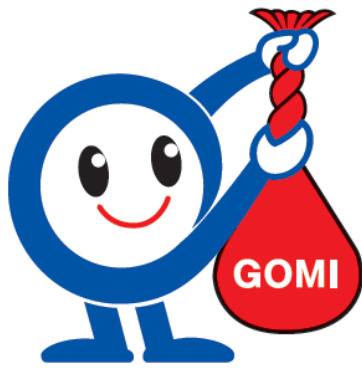
ごみ削減キャラクター へらそうくん