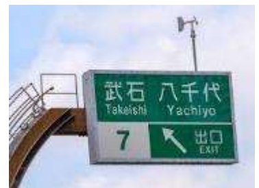
武石インター標示板