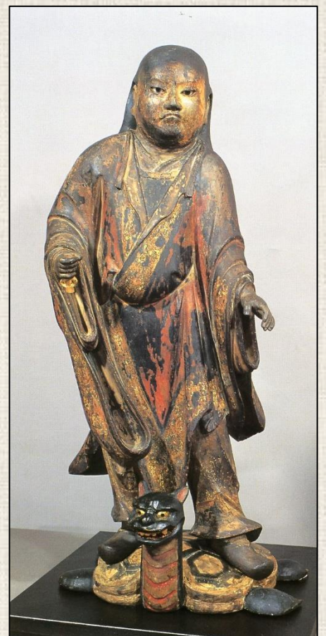
東庄町所蔵 木造妙見菩薩立像(鎌倉時代後期)

本講座は、生涯学習センターの講座映像をオンライン配信します。 質疑応答はできません。