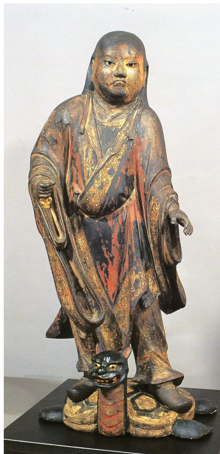
東庄町所蔵 木造妙見菩薩立像(鎌倉時代後期)

本講座は、生涯学習センターの講座映像のオンライン配信です。会場に講師はおりませんので質疑応答の対応はできないことをご承知おきください。