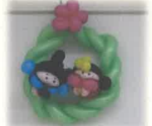
バルーンアート 雛人形の飾り↑