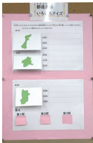
第2弾 都道府県クイズ