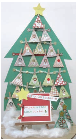
児童書の紹介を兼ねたアドベントカレンダー