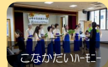
こなかだいハルモニ