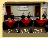
ミュージックパルフール