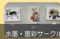
水墨・墨彩サークル