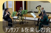
アンサンブルを楽しむ会