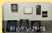
たいようこうレゾーク