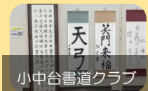
小中台書道クラブ