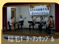
稲毛ギターアンサンブル