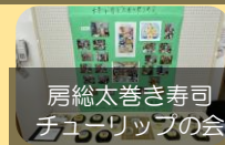
房総太巻き寿司 チューリップの会