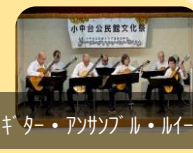
ギター・アンプ・ライト