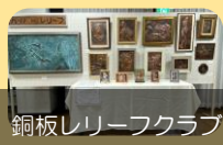
銅板レリーフクラブ