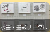
水墨・墨彩サークル