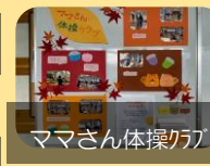
ママさん体操クラブ