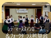
シェイスイガーズ &フォークソング草会