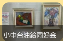
小中台油絵同好会