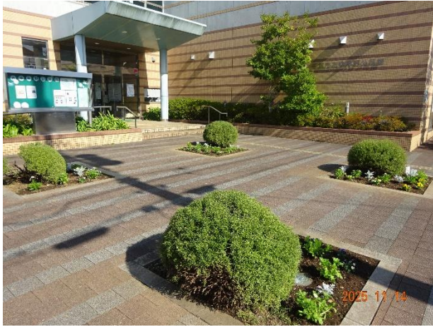
生涯大学のボランティアによる花壇

編集・発行 千葉市おゆみ野公民館 千葉市緑区おゆみ野中央2丁目7番地6 電話 043-293-1520 FAX 043-293-1521