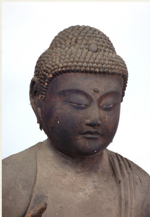
大多喜町長楽寺 阿弥陀如来立像 慶派作 鎌倉時代初期

中世前期の房総に君臨した二大勢力・上総氏と千葉氏の支配の実態について、上総・下総に遺された仏像から再考します。